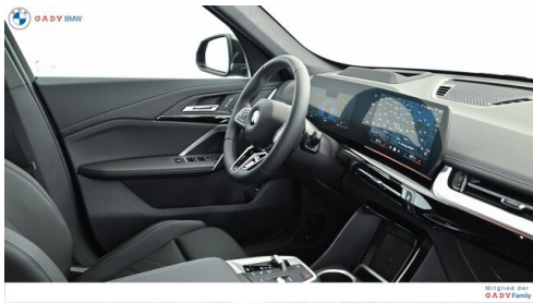
Mitglied der GADY Family