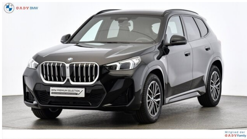
Mitglied der GADY Family