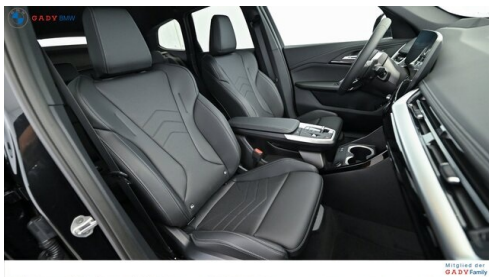
Mitglied der GADY Family