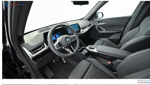
Mitglied der GADY Family