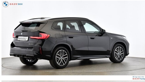
Mitglied der GADY Family