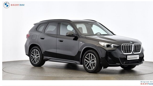
Mitglied der GADY Family