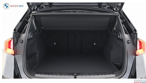
Mitglied der GADY Family