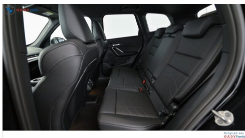
Mitglied der GADY Family