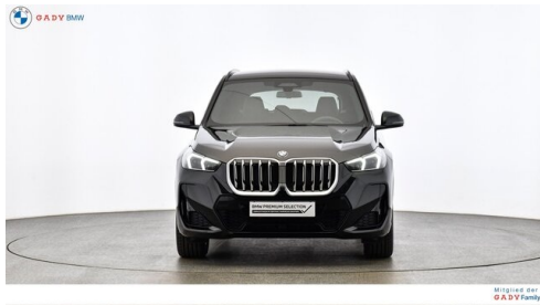
Mitglied der GADY Family