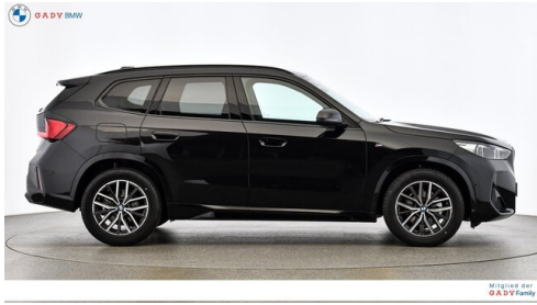
Mitglied der GADY Family