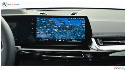
Mitglied der GADY Family