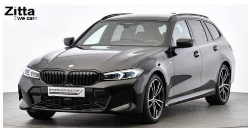
Zitta Betriebs GmbH - Wien - www.zitta.at