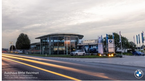
Autohaus BMW Reichhart Mugger-Gürtel 6, 4110 Mauthausen +43 29 20 20 89, www.bmw-reichhart.at