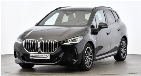
Hans Geyrhofer & Sohn GesmbH - Wels - www.geyrhofer.bmw.at