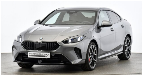
drive ME GmbH - Regau - www.driveme.bmw.at