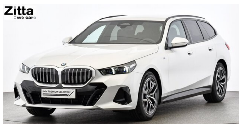
Zitta Betriebs GmbH - Wien - www.zitta.at