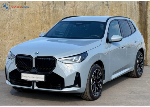
Miğnes der GADY Family