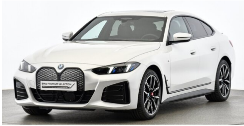
Bierbaum GmbH - Eisenstadt - www.bmw-bierbaum.at