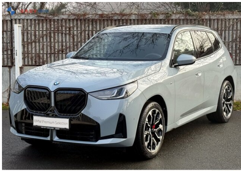
Mitglied der GADV Family