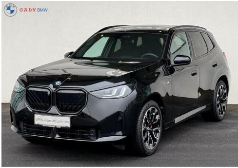
Mitglied der GADY Family