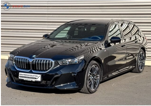
Miglius der GADV Family