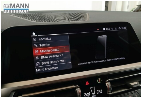
AUTOHAUS JOSEF MANN - PRESSBAUM - WWW.MANN.BMW.AT