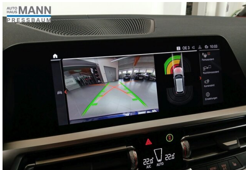
AUTOHAUS JOSEF MANN - PRESSBAUM - WWW.MANN.BMW.AT