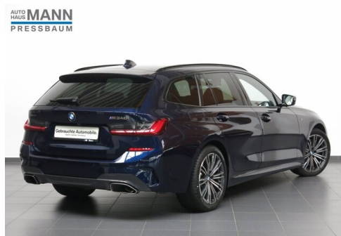
AUTOHAUS JOSEF MANN - PRESSBAUM - WWW.MANN.BMW.AT