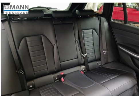
AUTOHAUS JOSEF MANN - PRESSBAUM - WWW.MANN.BMW.AT