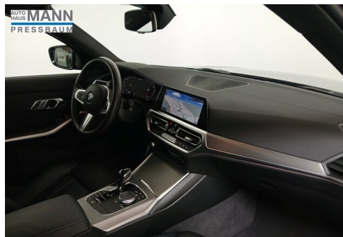
AUTOHAUS JOSEF MANN - PRESSBAUM - WWW.MANN.BMW.AT