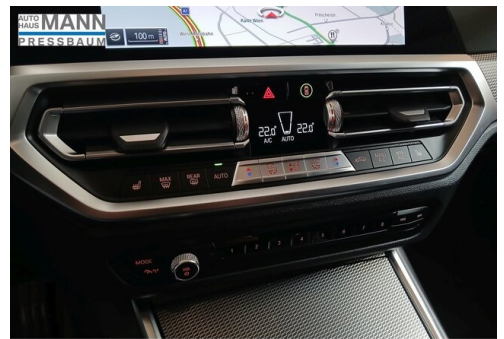
AUTOHAUS JOSEF MANN - PRESSBAUM - WWW.MANN.BMW.AT