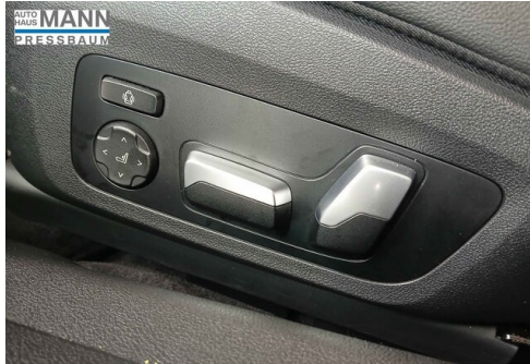
AUTOHAUS JOSEF MANN - PRESSBAUM - WWW.MANN.BMW.AT