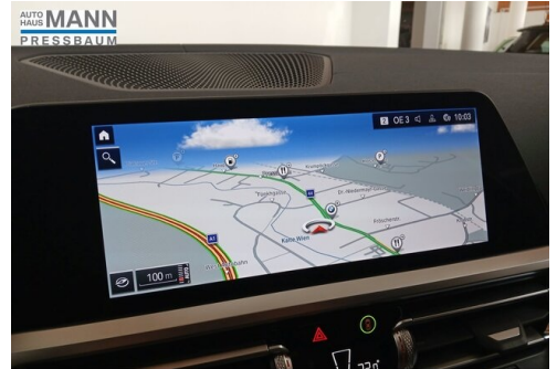
AUTOHAUS JOSEF MANN - PRESSBAUM - WWW.MANN.BMW.AT