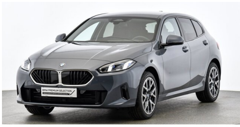
Bierbaum GmbH - Eisenstadt - www.bmw-bierbaum.at