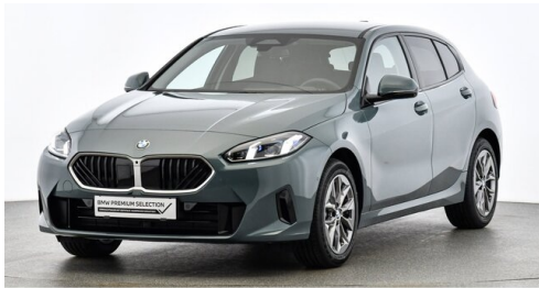
Autohaus Plattner GmbH - Langenrohr - www.plattner.bmw.at