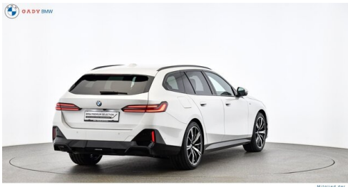
Migliore del GADY Family