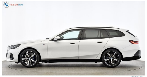
Migliore del GADY Family