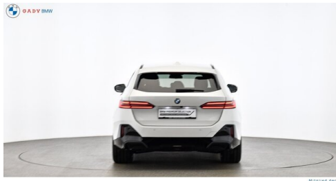
Migliore del GADY Family