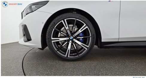
Migliore del GADY Family