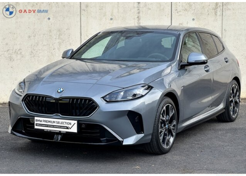
Mitglied der GADY Family