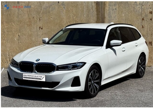
Miglior del GADV Family