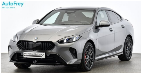
AutoFrey - St.Veit - www.autofrey.at