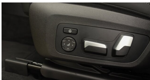
Autohaus Harmtodt - Grafendorf - www.harmtodt.bmw.at