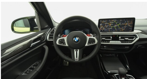
Autohaus Harmtodt - Grafendorf - www.harmtodt.bmw.at