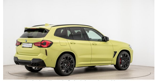
Autohaus Harmtodt - Grafendorf - www.harmtodt.bmw.at