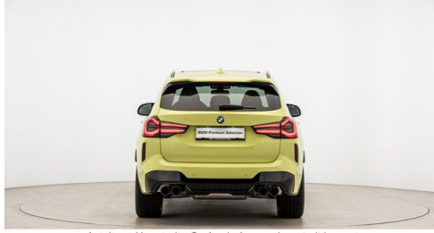
Autohaus Harmtodt - Grafendorf - www.harmtodt.bmw.at