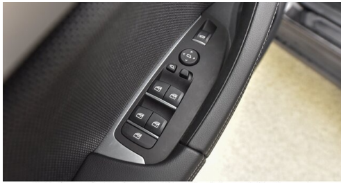
Kohla-Strauss GmbH - St. Michael/Oberpullendorf - www.kohla-strauss.at