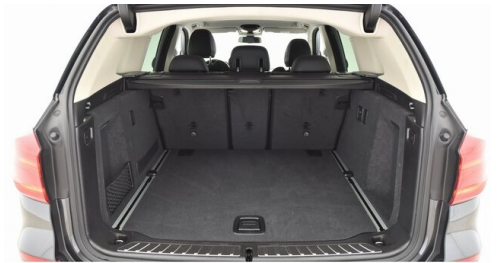
Kohla-Strauss GmbH - St. Michael/Oberpullendorf - www.kohla-strauss.at