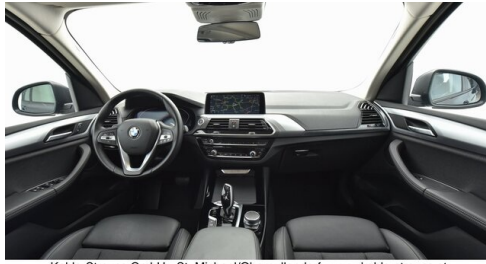
Kohla-Strauss GmbH - St. Michael/Oberpullendorf - www.kohla-strauss.at