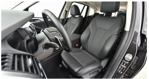
Kohla-Strauss GmbH - St. Michael/Oberpullendorf - www.kohla-strauss.at