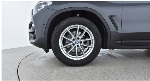
Kohla-Strauss GmbH - St. Michael/Oberpullendorf - www.kohla-strauss.at

(1) Die angegebenen Werte über Kraftstoffverbrauch und CO 2 -Emissionen wurden nach den vorgeschriebenen Messverfahren gem. VO (EG) 715/2007 ermittelt. Als Basis für die Verbrauchsermittlung gilt der ECE-Fahrzyklus (NEFZ). Dieser setzt sich aus ca. einem Drittel Fahrt innerorts und zwei Drittel außerorts (gemessen an der Wegstrecke) zusammen. Zusätzlich zum Verbrauch wird die CO 2 -Emission gemessen.