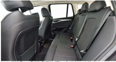
Kohla-Strauss GmbH - St. Michael/Oberpullendorf - www.kohla-strauss.at