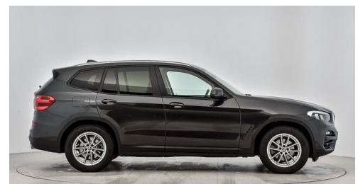
Kohla-Strauss GmbH - St. Michael/Oberpullendorf - www.kohla-strauss.at