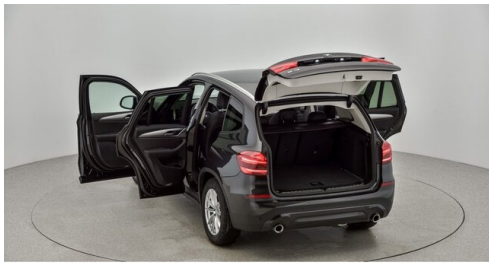
Kohla-Strauss GmbH - St. Michael/Oberpullendorf - www.kohla-strauss.at