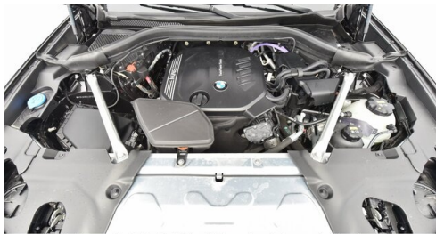
Kohla-Strauss GmbH - St. Michael/Oberpullendorf - www.kohla-strauss.at