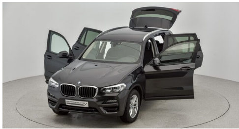
Kohla-Strauss GmbH - St. Michael/Oberpullendorf - www.kohla-strauss.at