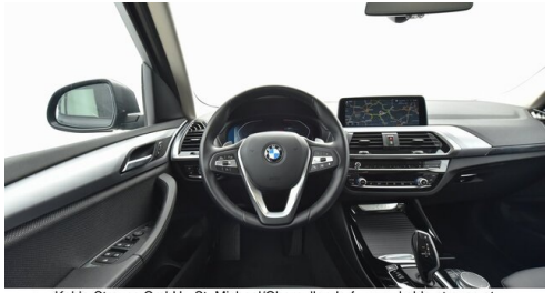
Kohla-Strauss GmbH - St. Michael/Oberpullendorf - www.kohla-strauss.at