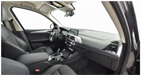
Kohla-Strauss GmbH - St. Michael/Oberpullendorf - www.kohla-strauss.at