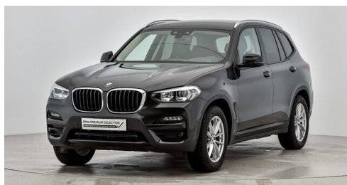
Kohla-Strauss GmbH - St. Michael/Oberpullendorf - www.kohla-strauss.at