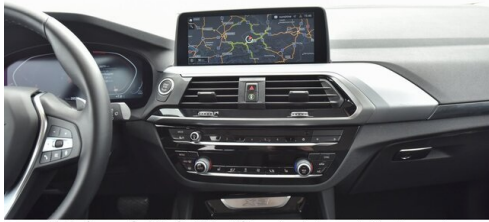
Kohla-Strauss GmbH - St. Michael/Oberpullendorf - www.kohla-strauss.at