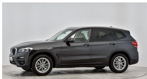
Kohla-Strauss GmbH - St. Michael/Oberpullendorf - www.kohla-strauss.at