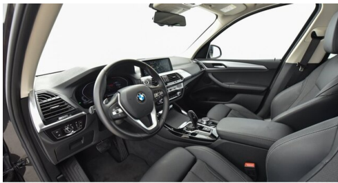
Kohla-Strauss GmbH - St. Michael/Oberpullendorf - www.kohla-strauss.at