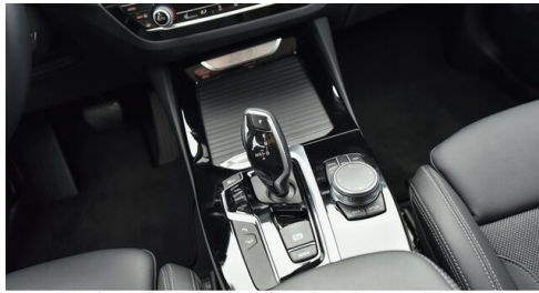
Kohla-Strauss GmbH - St. Michael/Oberpullendorf - www.kohla-strauss.at