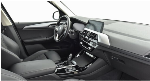
Kohla-Strauss GmbH - St. Michael/Oberpullendorf - www.kohla-strauss.at