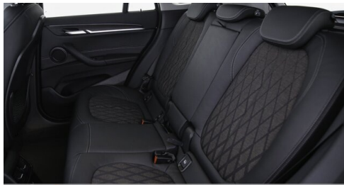
bmw-reichhart.at | 07238 2588 | info@reichhart.bmw.at