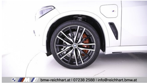
bmw-reichhart.at | 07238 2588 | info@reichhart.bmw.at