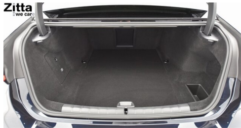
Zitta Betriebs GmbH - Perchtoldsdorf - www.zitta.at