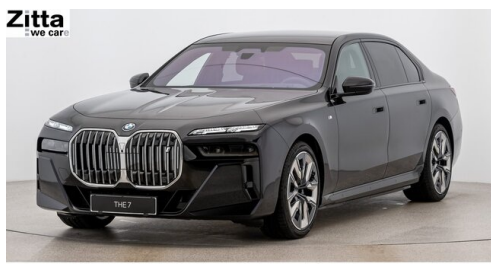
Zitta Betriebs GmbH - Perchtoldsdorf - www.zitta.at