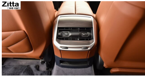
Zitta Betriebs GmbH - Perchtoldsdorf - www.zitta.at