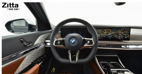
Zitta Betriebs GmbH - Perchtoldsdorf - www.zitta.at