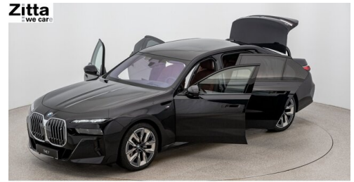
Zitta Betriebs GmbH - Perchtoldsdorf - www.zitta.at