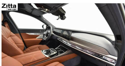
Zitta Betriebs GmbH - Perchtoldsdorf - www.zitta.at