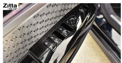
Zitta Betriebs GmbH - Perchtoldsdorf - www.zitta.at