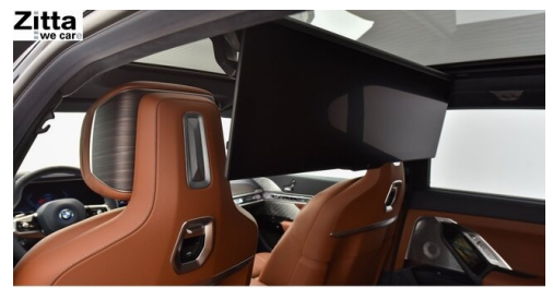
Zitta Betriebs GmbH - Perchtoldsdorf - www.zitta.at