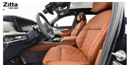
Zitta Betriebs GmbH - Perchtoldsdorf - www.zitta.at