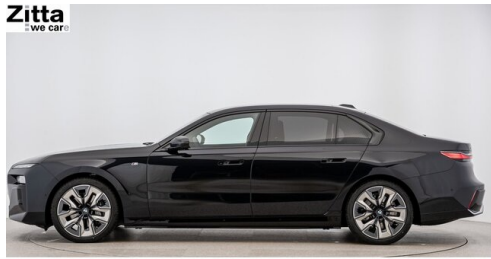
Zitta Betriebs GmbH - Perchtoldsdorf - www.zitta.at