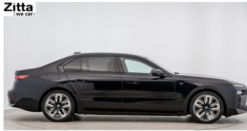
Zitta Betriebs GmbH - Perchtoldsdorf - www.zitta.at