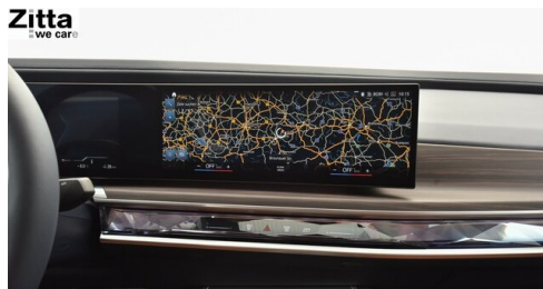
Zitta Betriebs GmbH - Perchtoldsdorf - www.zitta.at