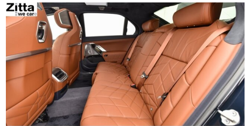
Zitta Betriebs GmbH - Perchtoldsdorf - www.zitta.at