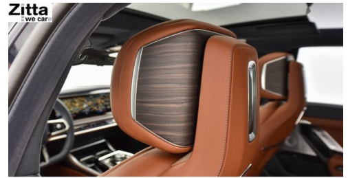
Zitta Betriebs GmbH - Perchtoldsdorf - www.zitta.at