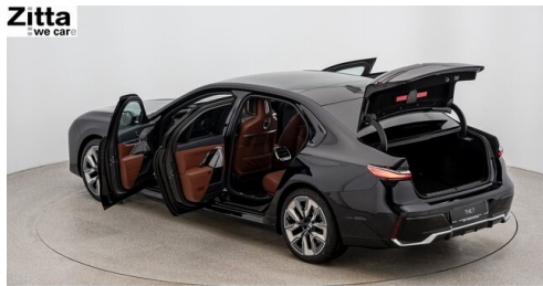
Zitta Betriebs GmbH - Perchtoldsdorf - www.zitta.at