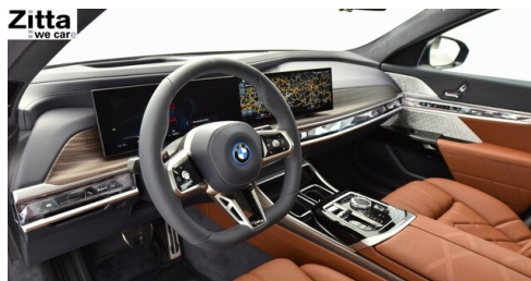
Zitta Betriebs GmbH - Perchtoldsdorf - www.zitta.at