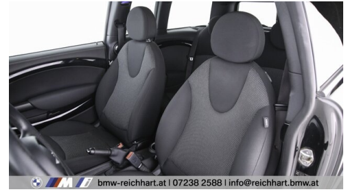
bmw-reichhart.at | 07238 2588 | info@reichhart.bmw.at