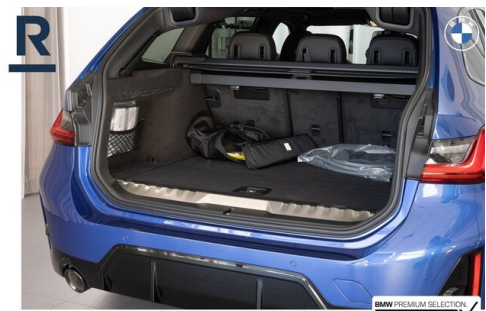
BMW PREMIUM SELECTION GEHECKT & GARANTIE!