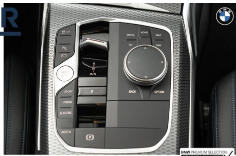
BMW PREMIUM SELECTION GEHECKT & GARANTIE!