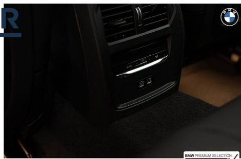
BMW PREMIUM SELECTION GEHECKT & GARANTIE!