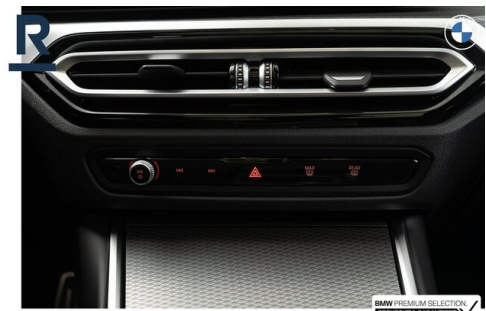
BMW PREMIUM SELECTION GEHECKT & GARANTIE!