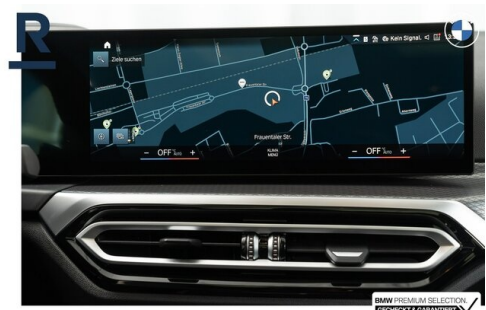
BMW PREMIUM SELECTION GEHECKT & GARANTIE!