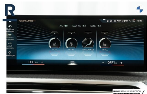
BMW PREMIUM SELECTION GEHECKT & GARANTIE!