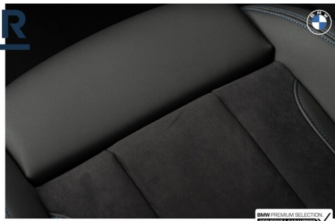
BMW PREMIUM SELECTION GEHECKT & GARANTIE!