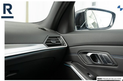
BMW PREMIUM SELECTION GEHECKT & GARANTIE!