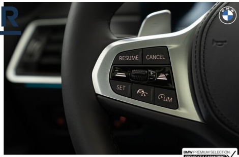
BMW PREMIUM SELECTION GEHECKT & GARANTIE!