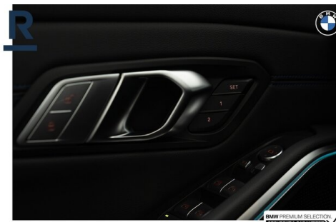
BMW PREMIUM SELECTION GEHECKT & GARANTIE!