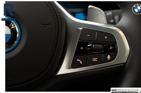
BMW PREMIUM SELECTION GEHECKT & GARANTIE!