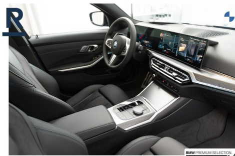
BMW PREMIUM SELECTION GEHECKT & GARANTIE!