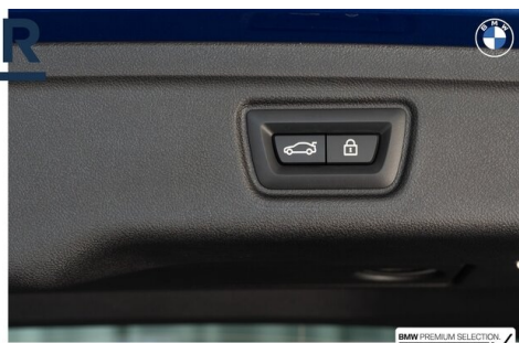
BMW PREMIUM SELECTION GEHECKT & GARANTIE!