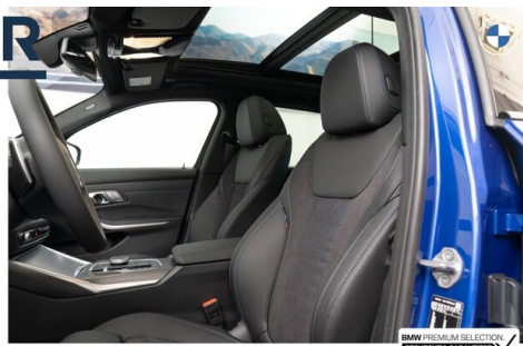
BMW PREMIUM SELECTION GEHECKT & GARANTIE!