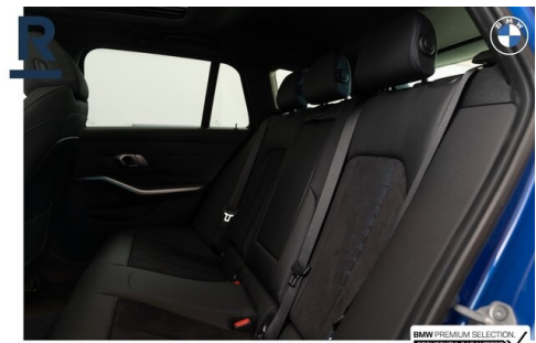
BMW PREMIUM SELECTION GEHECKT & GARANTIE!