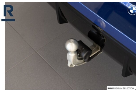
BMW PREMIUM SELECTION GEHECKT & GARANTIE!