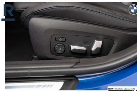
BMW PREMIUM SELECTION GEHECKT & GARANTIE!