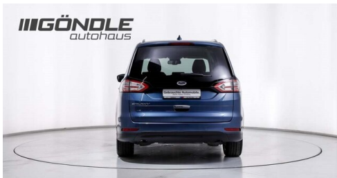
BMW & Mini Göndle - St. Pölten