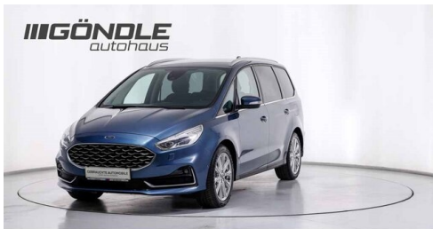
BMW & Mini Göndle - St. Pölten