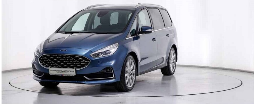
BMW & Mini Göndle - St. Pölten