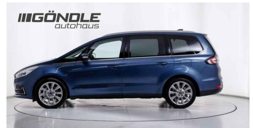
BMW & Mini Göndle - St. Pölten