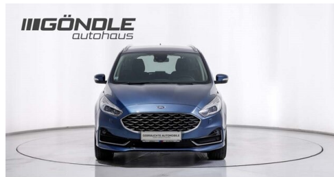
BMW & Mini Göndle - St. Pölten