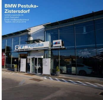
BMW Pestuka- Zistersdorf

Verkaufungsstraße 30 2020 Zistersdorf Email: info@pestuka.bmw.at Telefon: +43 65 699 70 25 22