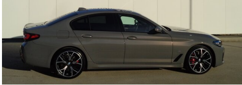
BMW Premium Selection. Gebrauchte Automobile.