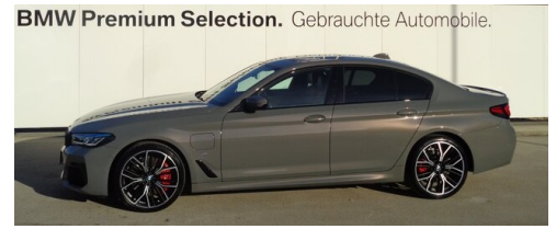
BMW Premium Selection. Gebrauchte Automobile.