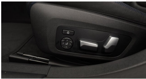
Automobile Knauss GmbH - Liezen - www.knauss.bmw.at