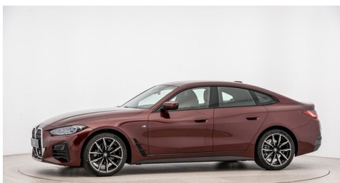
Automobile Knauss GmbH - Liezen - www.knauss.bmw.at