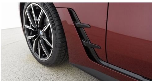
Automobile Knauss GmbH - Liezen - www.knauss.bmw.at