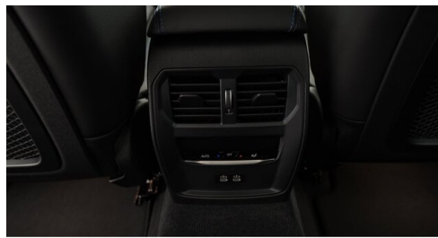
Automobile Knauss GmbH - Liezen - www.knauss.bmw.at