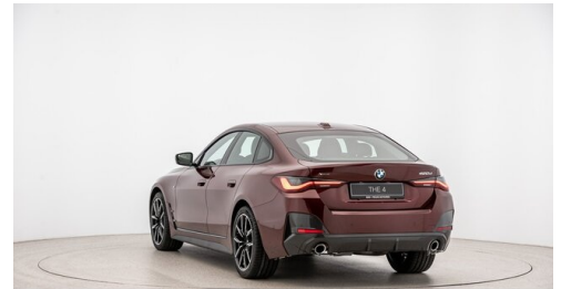
Automobile Knauss GmbH - Liezen - www.knauss.bmw.at