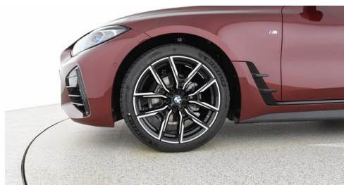
Automobile Knauss GmbH - Liezen - www.knauss.bmw.at

(1) Die angegebenen Werte über Kraftstoffverbrauch und CO 2 -Emissionen wurden nach den vorgeschriebenen Messverfahren gem. VO (EG) 715/2007 ermittelt. Als Basis für die Verbrauchsermittlung gilt der ECE-Fahrzyklus (NEFZ). Dieser setzt sich aus ca. einem Drittel Fahrt innerorts und zwei Drittel außerorts (gemessen an der Wegstrecke) zusammen. Zusätzlich zum Verbrauch wird die CO 2 -Emission gemessen.