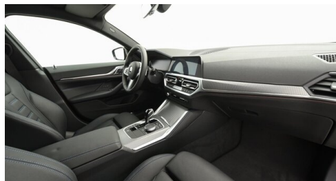
Automobile Knauss GmbH - Liezen - www.knauss.bmw.at