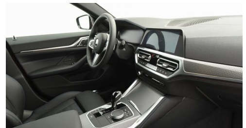
Automobile Knauss GmbH - Liezen - www.knauss.bmw.at