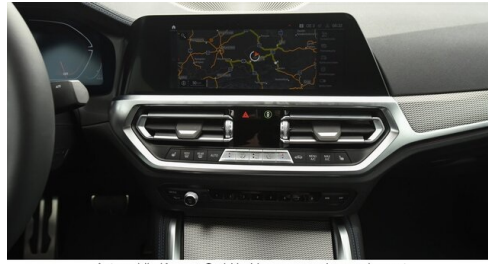
Automobile Knauss GmbH - Liezen - www.knauss.bmw.at