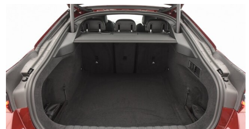
Automobile Knauss GmbH - Liezen - www.knauss.bmw.at