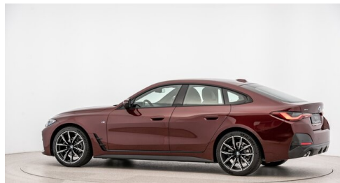
Automobile Knauss GmbH - Liezen - www.knauss.bmw.at