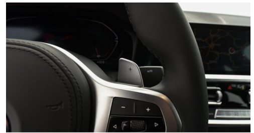
Automobile Knauss GmbH - Liezen - www.knauss.bmw.at