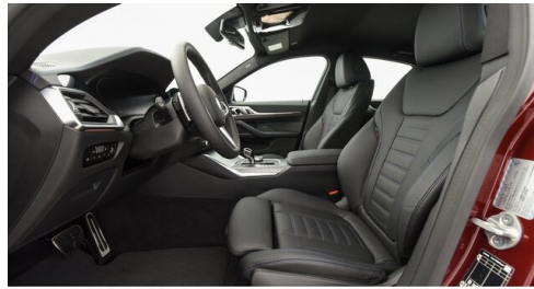
Automobile Knauss GmbH - Liezen - www.knauss.bmw.at