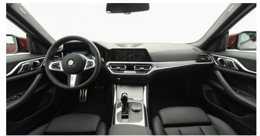
Automobile Knauss GmbH - Liezen - www.knauss.bmw.at