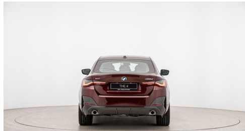
Automobile Knauss GmbH - Liezen - www.knauss.bmw.at