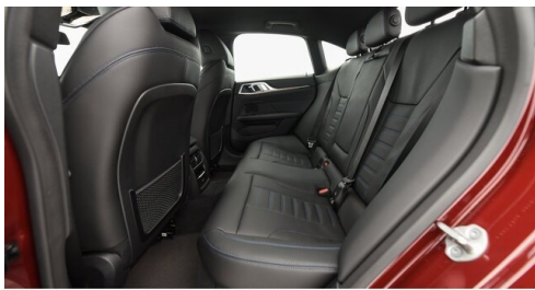
Automobile Knauss GmbH - Liezen - www.knauss.bmw.at