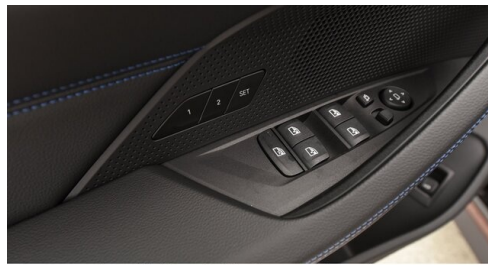
Automobile Knauss GmbH - Liezen - www.knauss.bmw.at