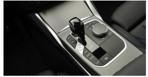
Automobile Knauss GmbH - Liezen - www.knauss.bmw.at