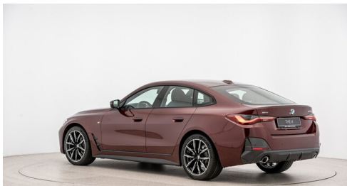
Automobile Knauss GmbH - Liezen - www.knauss.bmw.at