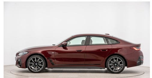
Automobile Knauss GmbH - Liezen - www.knauss.bmw.at