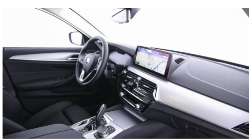
www.bmw-reichhart.at | 07238 2588 | info@reichhart.bmw.at