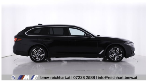
www.bmw-reichhart.at | 07238 2588 | info@reichhart.bmw.at