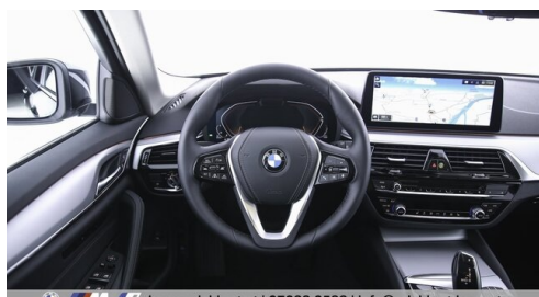
www.bmw-reichhart.at | 07238 2588 | info@reichhart.bmw.at