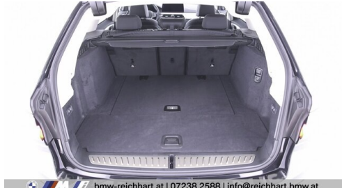
www.bmw-reichhart.at | 07238 2588 | info@reichhart.bmw.at