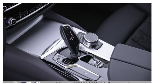
www.bmw-reichhart.at | 07238 2588 | info@reichhart.bmw.at