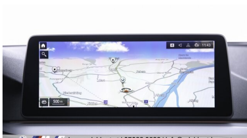
www.bmw-reichhart.at | 07238 2588 | info@reichhart.bmw.at