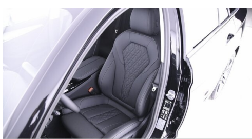
www.bmw-reichhart.at | 07238 2588 | info@reichhart.bmw.at