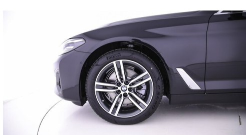
www.bmw-reichhart.at | 07238 2588 | info@reichhart.bmw.at