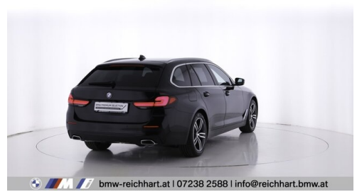
www.bmw-reichhart.at | 07238 2588 | info@reichhart.bmw.at