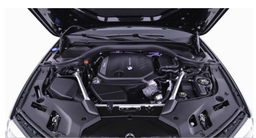
www.bmw-reichhart.at | 07238 2588 | info@reichhart.bmw.at