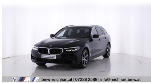
www.bmw-reichhart.at | 07238 2588 | info@reichhart.bmw.at