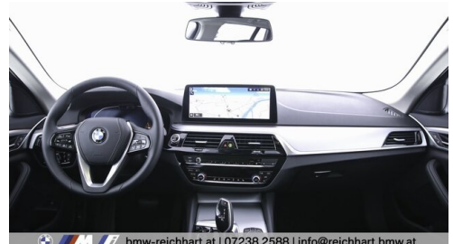
www.bmw-reichhart.at | 07238 2588 | info@reichhart.bmw.at