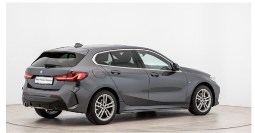
Autohaus Ing. Pestuka - Zistersdorf - www.pestuka.at