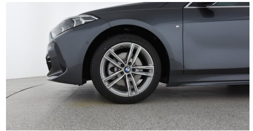
Autohaus Ing. Pestuka - Zistersdorf - www.pestuka.at