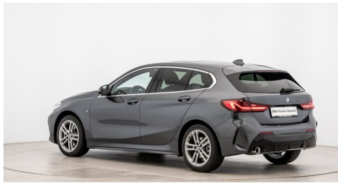
Autohaus Ing. Pestuka - Zistersdorf - www.pestuka.at