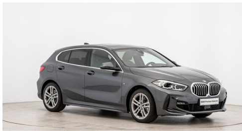
Autohaus Ing. Pestuka - Zistersdorf - www.pestuka.at