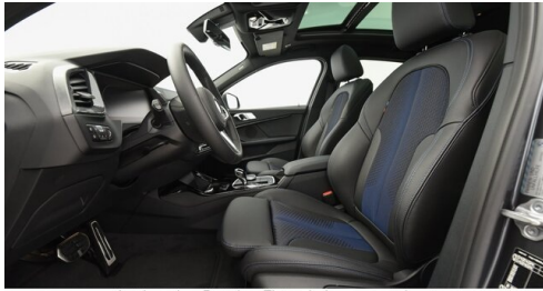
Autohaus Ing. Pestuka - Zistersdorf - www.pestuka.at