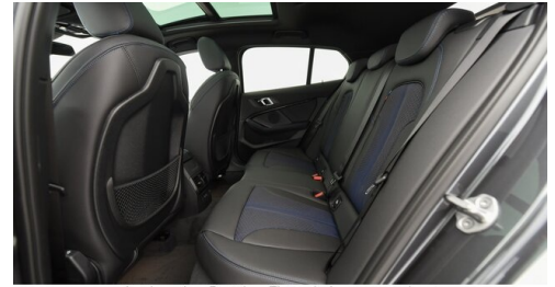
Autohaus Ing. Pestuka - Zistersdorf - www.pestuka.at