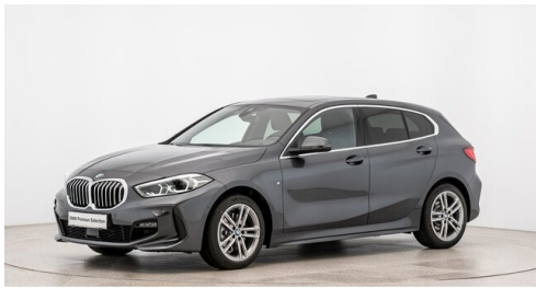
Autohaus Ing. Pestuka - Zistersdorf - www.pestuka.at