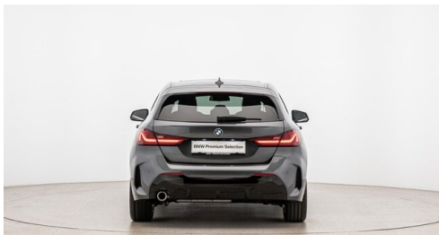
Autohaus Ing. Pestuka - Zistersdorf - www.pestuka.at