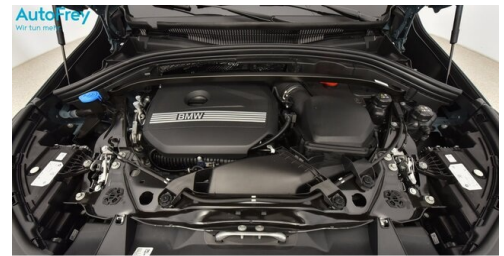
AutoFrey - St.Veit - www.autofrey.at