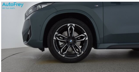
AutoFrey - St.Veit - www.autofrey.at

(1) Die angegebenen Werte über Kraftstoffverbrauch und CO 2 -Emissionen wurden nach den vorgeschriebenen Messverfahren gem. VO (EG) 715/2007 ermittelt. Als Basis für die Verbrauchsermittlung gilt der ECE-Fahrzyklus (NEFZ). Dieser setzt sich aus ca. einem Drittel Fahrt innerorts und zwei Drittel außerorts (gemessen an der Wegstrecke) zusammen. Zusätzlich zum Verbrauch wird die CO 2 -Emission gemessen.