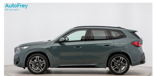
AutoFrey - St.Veit - www.autofrey.at