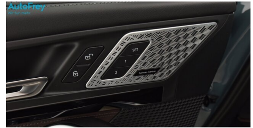
AutoFrey - St.Veit - www.autofrey.at