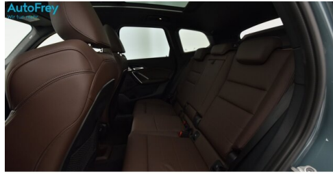
AutoFrey - St.Veit - www.autofrey.at