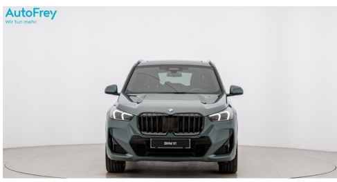
AutoFrey - St.Veit - www.autofrey.at