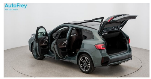
AutoFrey - St.Veit - www.autofrey.at