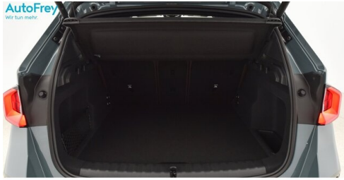
AutoFrey - St.Veit - www.autofrey.at