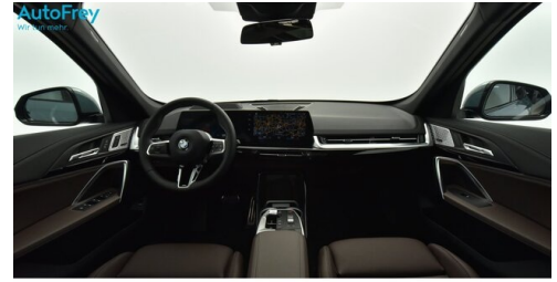
AutoFrey - St.Veit - www.autofrey.at