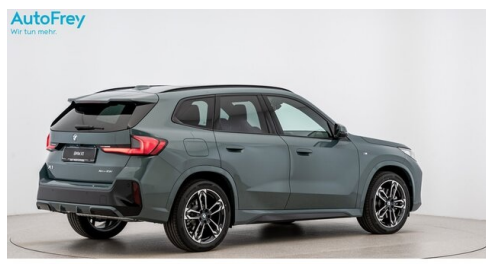
AutoFrey - St.Veit - www.autofrey.at