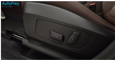
AutoFrey - St.Veit - www.autofrey.at