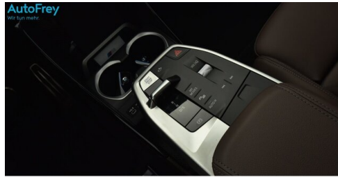
AutoFrey - St.Veit - www.autofrey.at