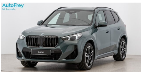
AutoFrey - St.Veit - www.autofrey.at