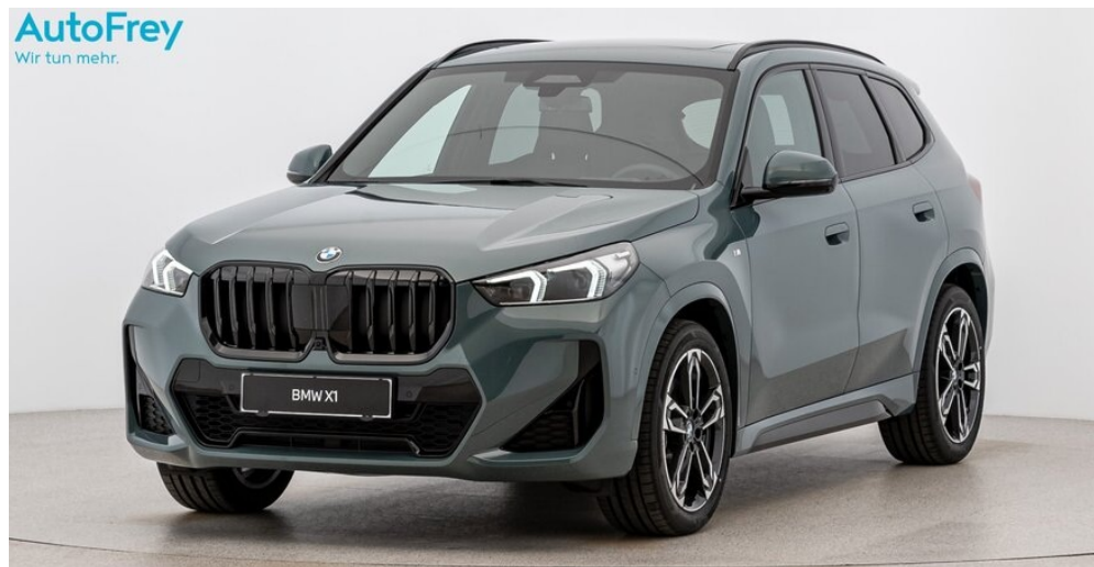
AutoFrey - St.Veit - www.autofrey.at