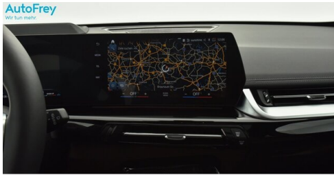
AutoFrey - St.Veit - www.autofrey.at