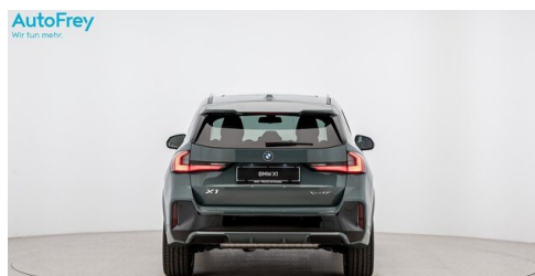
AutoFrey - St.Veit - www.autofrey.at