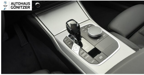
Autohaus Gönitzer GmbH - Wolfsberg - www.goenitzer.bmw.at