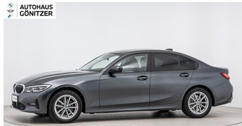
Autohaus Gönitzer GmbH - Wolfsberg - www.goenitzer.bmw.at