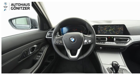
Autohaus Gönitzer GmbH - Wolfsberg - www.goenitzer.bmw.at