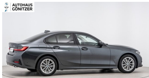
Autohaus Gönitzer GmbH - Wolfsberg - www.goenitzer.bmw.at