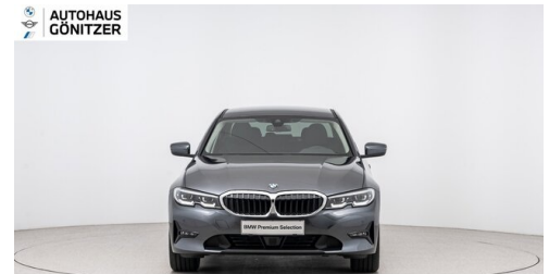
Autohaus Gönitzer GmbH - Wolfsberg - www.goenitzer.bmw.at