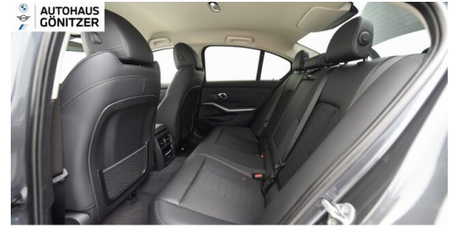
Autohaus Gönitzer GmbH - Wolfsberg - www.goenitzer.bmw.at