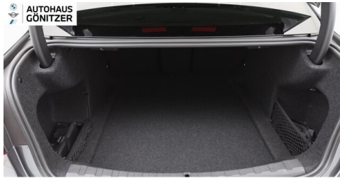
Autohaus Gönitzer GmbH - Wolfsberg - www.goenitzer.bmw.at