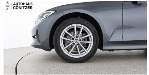
Autohaus Gönitzer GmbH - Wolfsberg - www.goenitzer.bmw.at