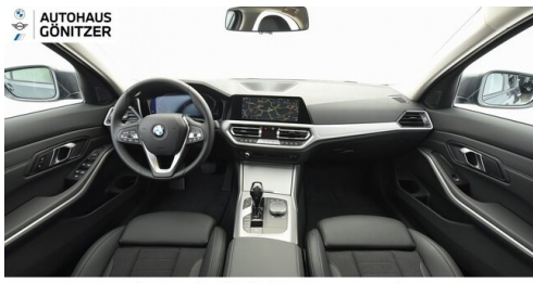
Autohaus Gönitzer GmbH - Wolfsberg - www.goenitzer.bmw.at