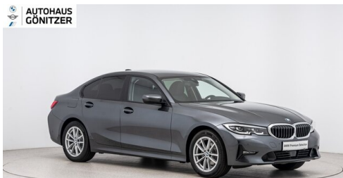
Autohaus Gönitzer GmbH - Wolfsberg - www.goenitzer.bmw.at