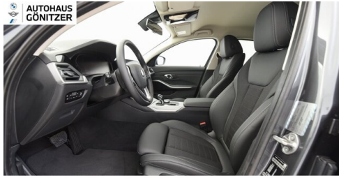
Autohaus Gönitzer GmbH - Wolfsberg - www.goenitzer.bmw.at