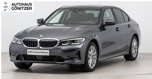
Autohaus Gönitzer GmbH - Wolfsberg - www.goenitzer.bmw.at