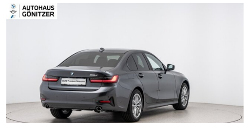
Autohaus Gönitzer GmbH - Wolfsberg - www.goenitzer.bmw.at