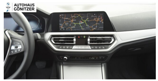
Autohaus Gönitzer GmbH - Wolfsberg - www.goenitzer.bmw.at