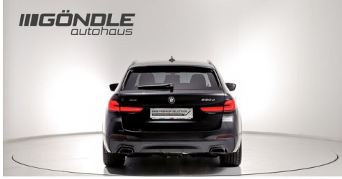
BMW & Mini Göndle - St. Pölten