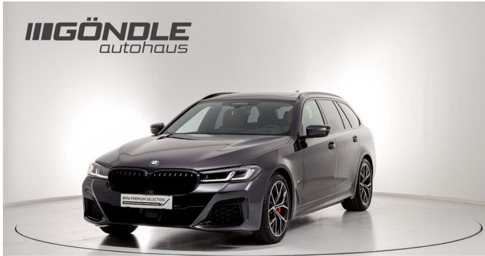
BMW & Mini Göndle - St. Pölten

BMW PREMIUM SELECTION INKL. 24 MONATE GARANTIE