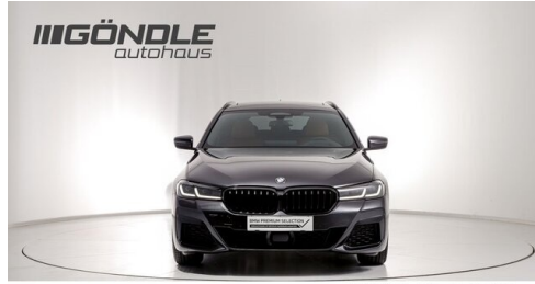
BMW & Mini Göndle - St. Pölten