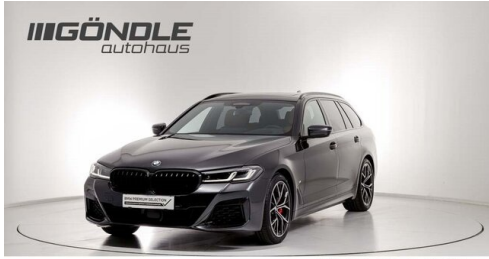
BMW & Mini Göndle - St. Pölten