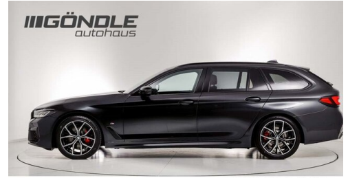
BMW & Mini Göndle - St. Pölten