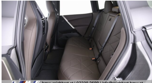
bmw-reichhart.at | 07238 2588 | info@reichhart.bmw.at