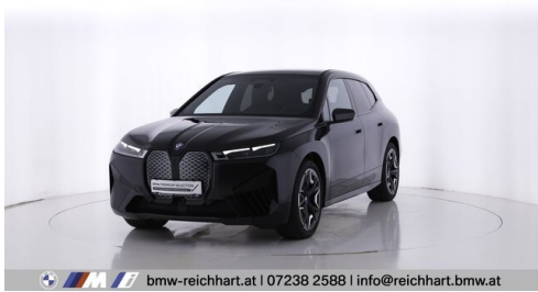
bmw-reichhart.at | 07238 2588 | info@reichhart.bmw.at