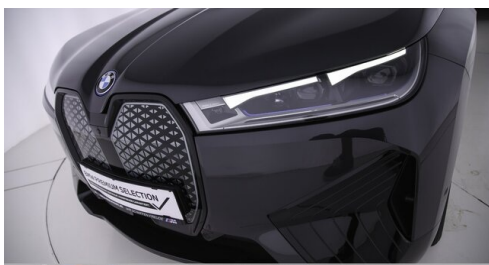
bmw-reichhart.at | 07238 2588 | info@reichhart.bmw.at