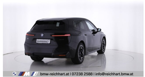
bmw-reichhart.at | 07238 2588 | info@reichhart.bmw.at