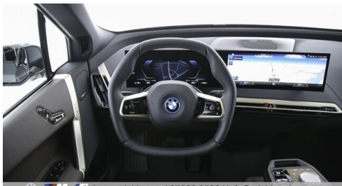
bmw-reichhart.at | 07238 2588 | info@reichhart.bmw.at