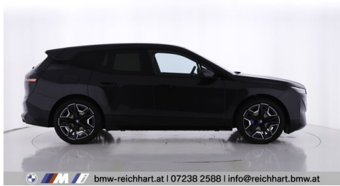
bmw-reichhart.at | 07238 2588 | info@reichhart.bmw.at