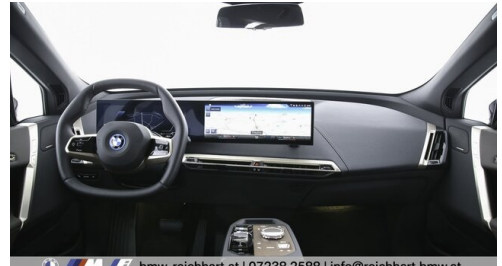
bmw-reichhart.at | 07238 2588 | info@reichhart.bmw.at