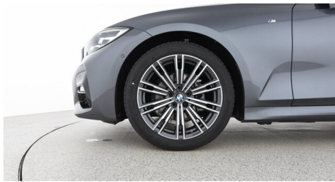
Autohaus Harmtodt - Grafendorf - www.harmtodt.bmw.at