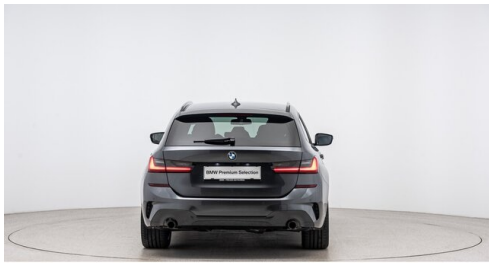
Autohaus Harmtodt - Grafendorf - www.harmtodt.bmw.at