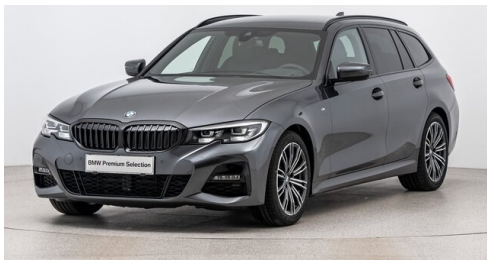
Autohaus Harmtodt - Grafendorf - www.harmtodt.bmw.at