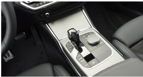
Autohaus Harmtodt - Grafendorf - www.harmtodt.bmw.at