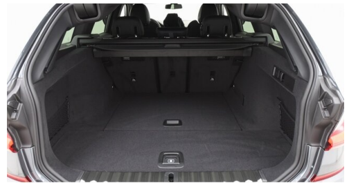
Autohaus Harmtodt - Grafendorf - www.harmtodt.bmw.at