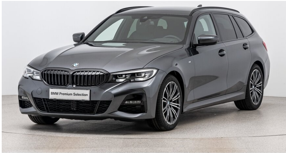
Autohaus Harmtodt - Grafendorf - www.harmtodt.bmw.at