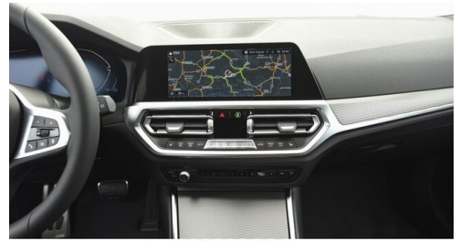
Autohaus Harmtodt - Grafendorf - www.harmtodt.bmw.at