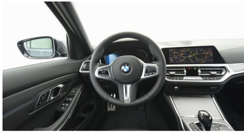
Autohaus Harmtodt - Grafendorf - www.harmtodt.bmw.at