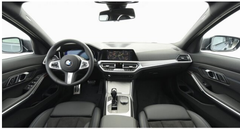
Autohaus Harmtodt - Grafendorf - www.harmtodt.bmw.at