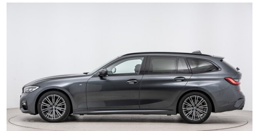
Autohaus Harmtodt - Grafendorf - www.harmtodt.bmw.at