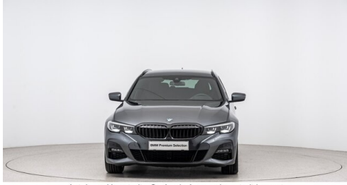
Autohaus Harmtodt - Grafendorf - www.harmtodt.bmw.at