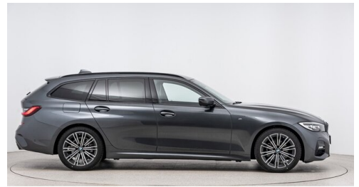
Autohaus Harmtodt - Grafendorf - www.harmtodt.bmw.at