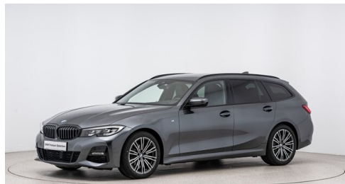
Autohaus Harmtodt - Grafendorf - www.harmtodt.bmw.at