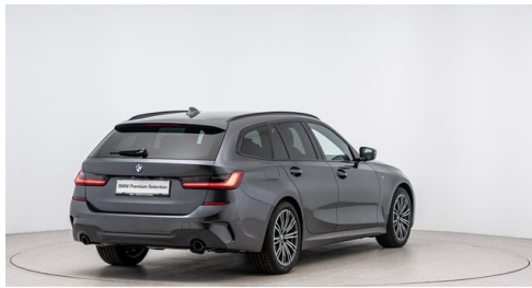
Autohaus Harmtodt - Grafendorf - www.harmtodt.bmw.at