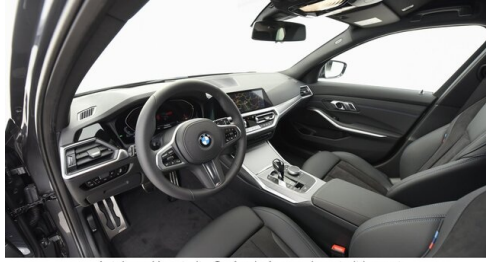
Autohaus Harmtodt - Grafendorf - www.harmtodt.bmw.at