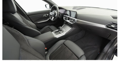
Autohaus Harmtodt - Grafendorf - www.harmtodt.bmw.at