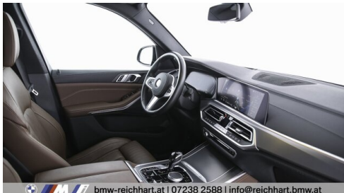
bmw-reichhart.at | 07238 2588 | info@reichhart.bmw.at