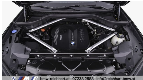
bmw-reichhart.at | 07238 2588 | info@reichhart.bmw.at