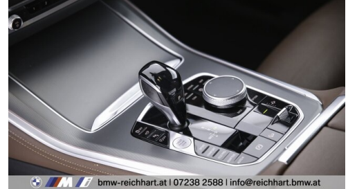
bmw-reichhart.at | 07238 2588 | info@reichhart.bmw.at