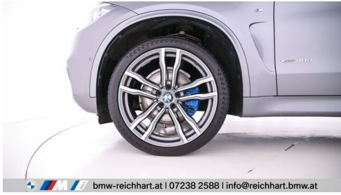
bmw-reichhart.at | 07238 2588 | info@reichhart.bmw.at