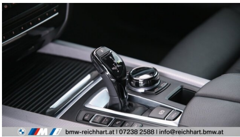
bmw-reichhart.at | 07238 2588 | info@reichhart.bmw.at