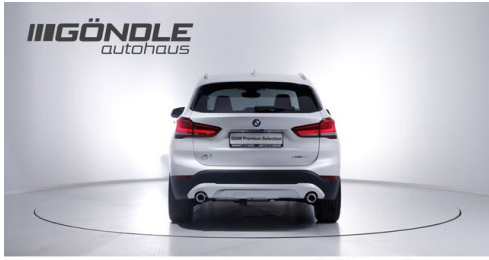
BMW & Mini Gündle - St. Pölten