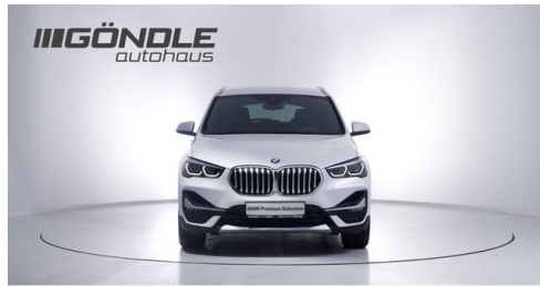
BMW & Mini Gündle - St. Pölten