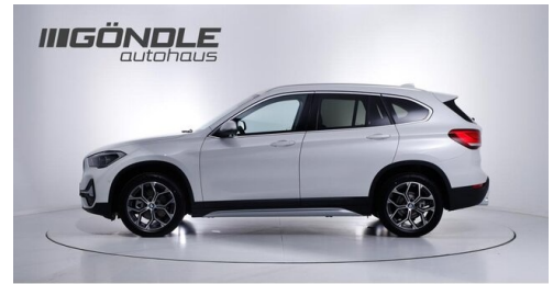
BMW & Mini Gündle - St. Pölten