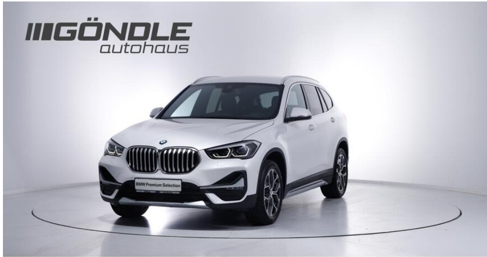
BMW & Mini Göndle - St. Pölten

BMW PREMIUM SELECTION INKL. 24 MONATE GARANTIE