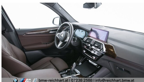
bmw-reichhart.at | 07238 2588 | info@reichhart.bmw.at