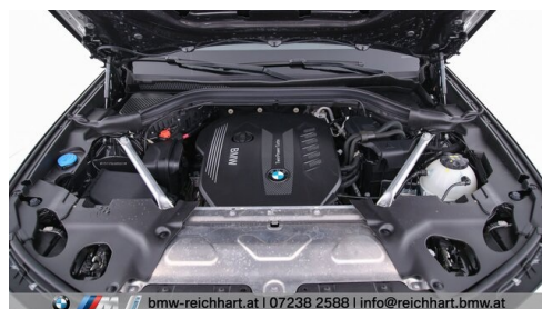
bmw-reichhart.at | 07238 2588 | info@reichhart.bmw.at