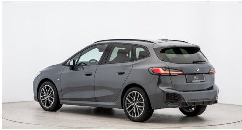
Autohaus Ing. Pestuka - Zistersdorf - www.pestuka.at