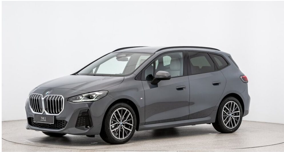
Autohaus Ing. Pestuka - Zistersdorf - www.pestuka.at

BMW PREMIUM SELECTION INKL. 24 MONATE GARANTIE