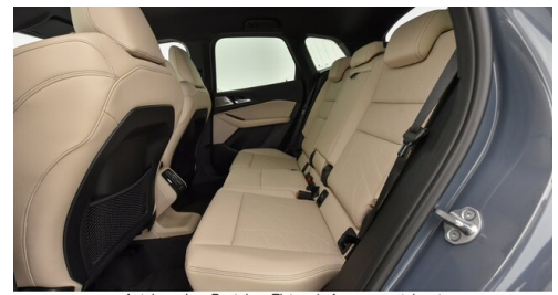
Autohaus Ing. Pestuka - Zistersdorf - www.pestuka.at