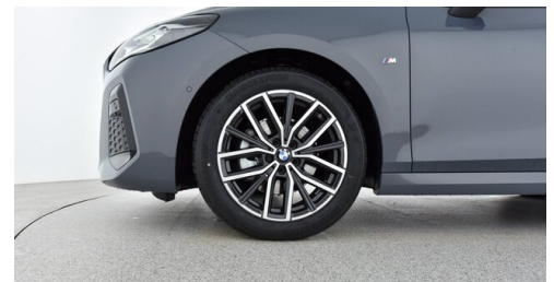
Autohaus Ing. Pestuka - Zistersdorf - www.pestuka.at