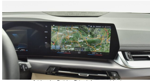
Autohaus Ing. Pestuka - Zistersdorf - www.pestuka.at