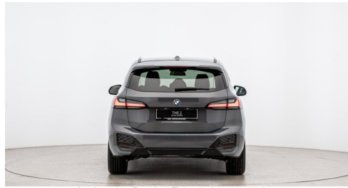
Autohaus Ing. Pestuka - Zistersdorf - www.pestuka.at