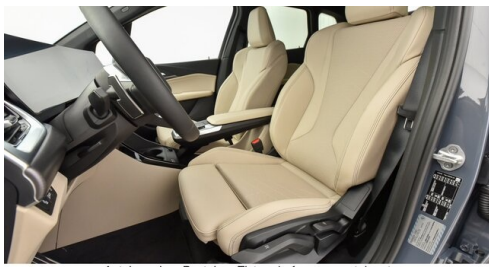
Autohaus Ing. Pestuka - Zistersdorf - www.pestuka.at