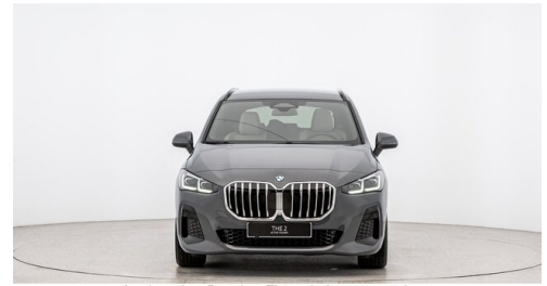
Autohaus Ing. Pestuka - Zistersdorf - www.pestuka.at