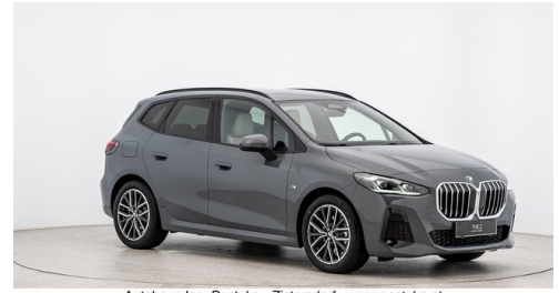
Autohaus Ing. Pestuka - Zistersdorf - www.pestuka.at