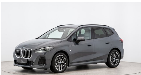
Autohaus Ing. Pestuka - Zistersdorf - www.pestuka.at