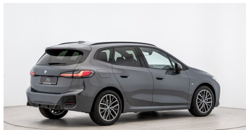
Autohaus Ing. Pestuka - Zistersdorf - www.pestuka.at