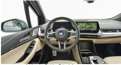
Autohaus Ing. Pestuka - Zistersdorf - www.pestuka.at