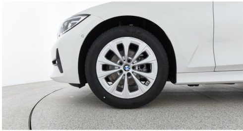
Kohla-Strauss GmbH - St. Michael/Oberpullendorf - www.kohla-strauss.at