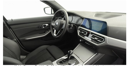
Kohla-Strauss GmbH - St. Michael/Oberpullendorf - www.kohla-strauss.at