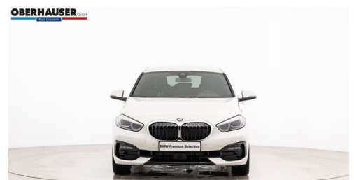
Oberhauser GmbH - Bad Goisern - www.oberhauser.bmw.at