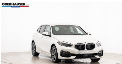
Oberhauser GmbH - Bad Goisern - www.oberhauser.bmw.at