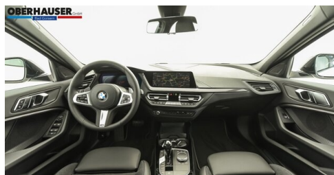
Oberhauser GmbH - Bad Goisern - www.oberhauser.bmw.at