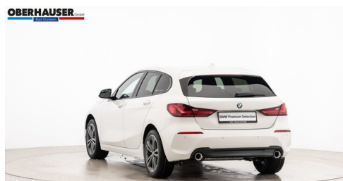
Oberhauser GmbH - Bad Goisern - www.oberhauser.bmw.at