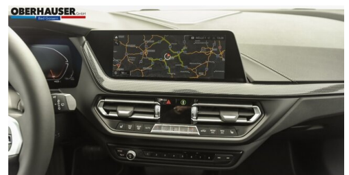
Oberhauser GmbH - Bad Goisern - www.oberhauser.bmw.at