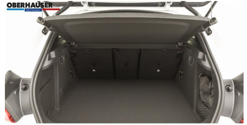
Oberhauser GmbH - Bad Goisern - www.oberhauser.bmw.at