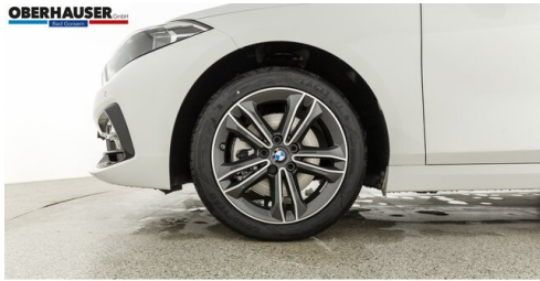
Oberhauser GmbH - Bad Goisern - www.oberhauser.bmw.at