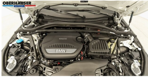
Oberhauser GmbH - Bad Goisern - www.oberhauser.bmw.at