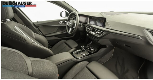
Oberhauser GmbH - Bad Goisern - www.oberhauser.bmw.at