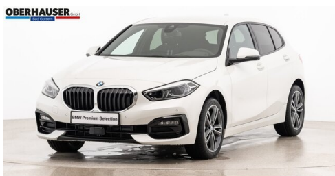
Oberhauser GmbH - Bad Goisern - www.oberhauser.bmw.at