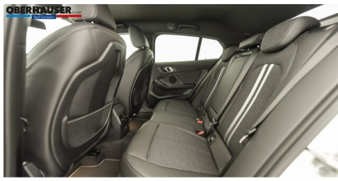
Oberhauser GmbH - Bad Goisern - www.oberhauser.bmw.at