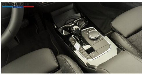
Oberhauser GmbH - Bad Goisern - www.oberhauser.bmw.at